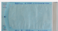
پاکت استریل چسب دار: