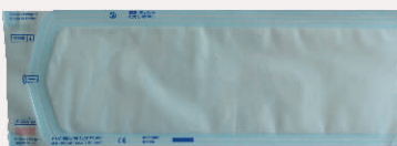
پاکت استریل ساده - بدون چسب):